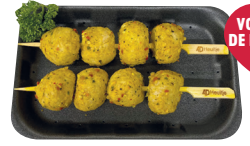
Balletjesbrochette Voorgegaard €15,99/kg _____ x 2 stuks