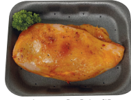
Gemarineerde kipfilet Rood €14,99/kg _____ x 1 stuk