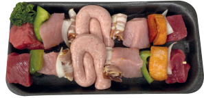
Schaslick brochette €19,99/kg _____ x 2 stuks