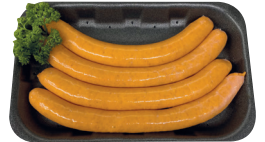
Merguezeworstjes €17,50/kg _____ x 4 stuks