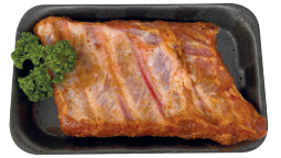
Gemarineerde ribben €11,99/kg _____ x 1 stuk