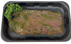
Lamsfilet gemarineerd €43,99/kg _____ x 1 stuk