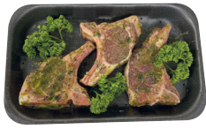
Lamskotelet gemarineerd €30,90/kg _____ x 3 stuks