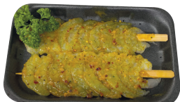
Garnalenspies €38,90/kg _____ x 2 stuks