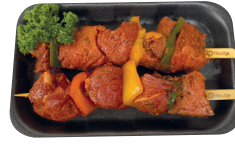
Gemarineerde rundsbrochette €21,99/kg _____ x 2 stuks