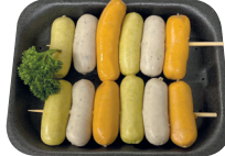
Mini BBQ brochette €22,90/kg _____ x 2 stuks