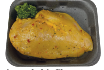
Gemarineerde kipfilet Geel €14,99/kg _____ x 1 stuk