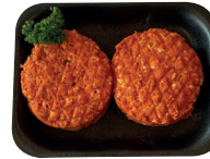
BBQ burger €13,99/kg _____ x x stuks