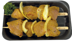
Gevogeltebrochette €16,99/kg _____ x 2 stuks