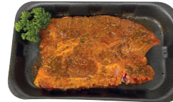
Gemarineerde spiering €10,99/kg _____ x 1 stuk