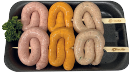
BBQ worstenbrochette €16,99/kg _____ x 2 stuks