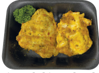
Gemarineerde kippenkotelet €11,99/kg _____ x 2 stuks