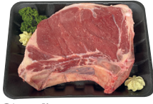
Côte à l'os ± 1,2 kg/stuk €21,60/kg _____ x 1 stuk