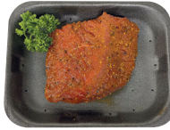
Gemarineerde steak €20,99/kg _____ x 1 stuk