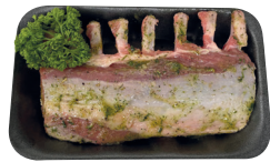
Lamskroontje gemarineerd €42,99/kg _____ x 1 stuk