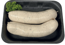
Witte pens €14,99/kg _____ x 2 stuks