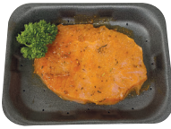
Gemarineerd varkenslapje €12,99/kg _____ x 1 stuk