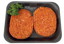
Bereide hamburger €13,99/kg _____ x 2 stuks