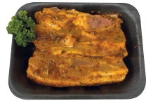
Gemarineerde vleesribben €10,95/kg _____ x 2 stuks