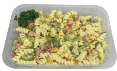
Koude pasta met honingmosterd ± 300 g €12,99/kg _____ x 1 stuk