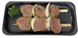
Varkenshaasbrochette €19,50/kg _____ x 2 stuks