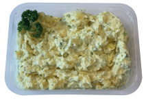
Ambachtelijke aardappelsalade €11,95/kg _____ x 1 stuk