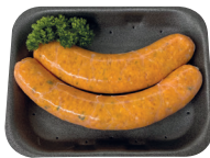
BBQ worst €13,99/kg _____ x 2 stuks