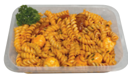
Koude pasta met rode pesto ± 300 g €15,40/kg _____ x 1 stuk