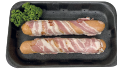
Bernersworstjes met spek en kaas €21,90/kg _____ x 2 stuks