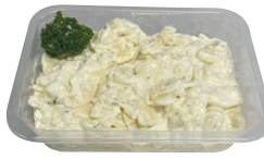
Aardappelsalade ± 600 g €8,69/kg _____ x 1 stuk