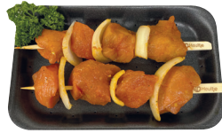
Varkensbrochette €16,99/kg _____ x 2 stuks