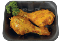
Gemarineerde kippenbout €10,45/kg _____ x 2 stuks