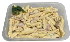
Koude pasta met ham ± 300 g €12,99/kg _____ x 1 stuk